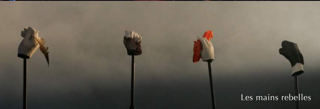
Les mains rebelles