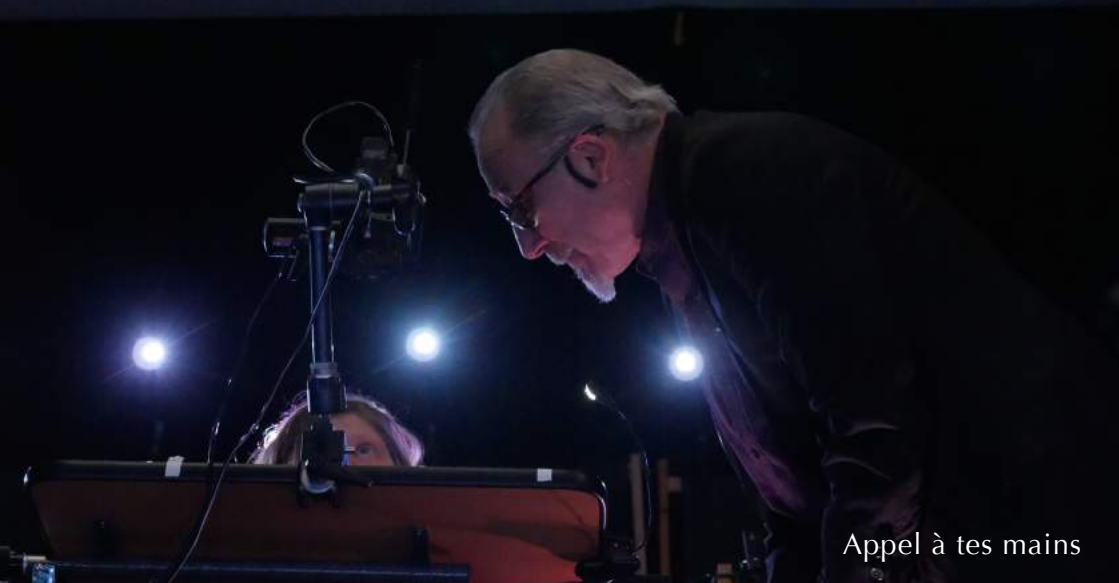
Appel à tes mains