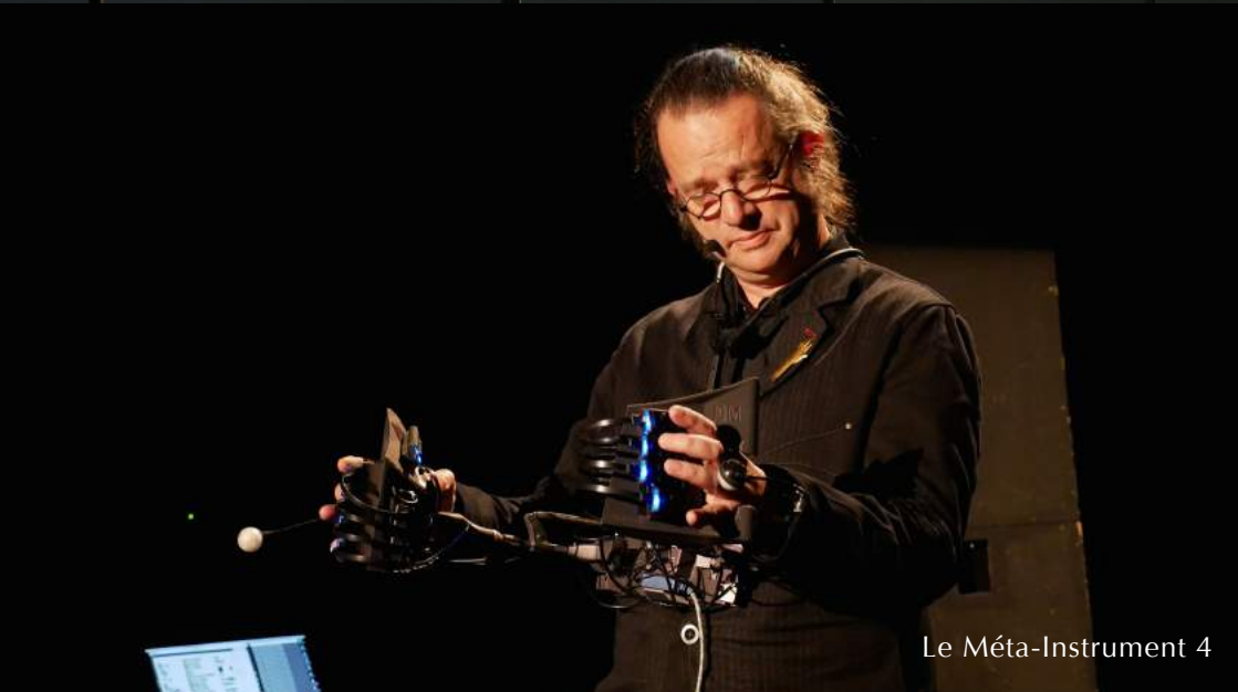
Le Méta-Instrument 4