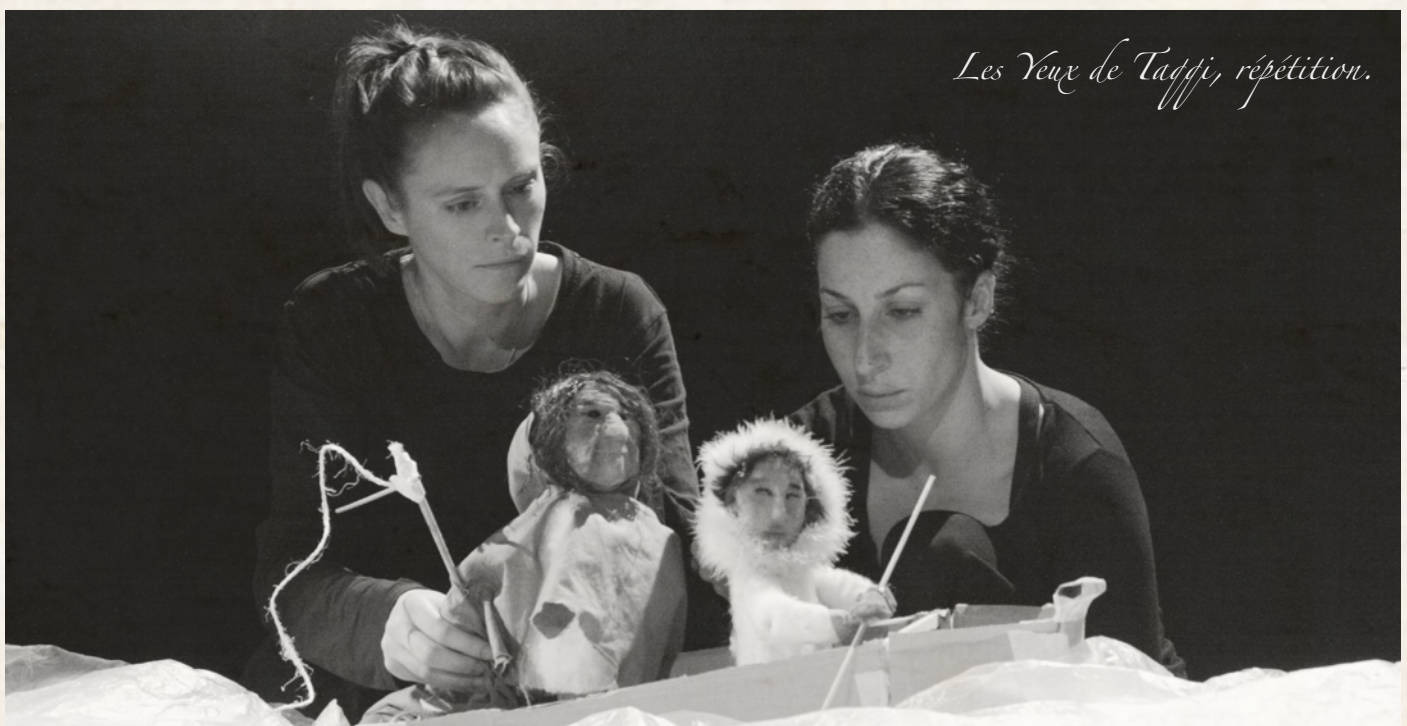
Les Yeux de Taqqi, répétition.

dans la catégorie « meilleur spectacle jeune public ».